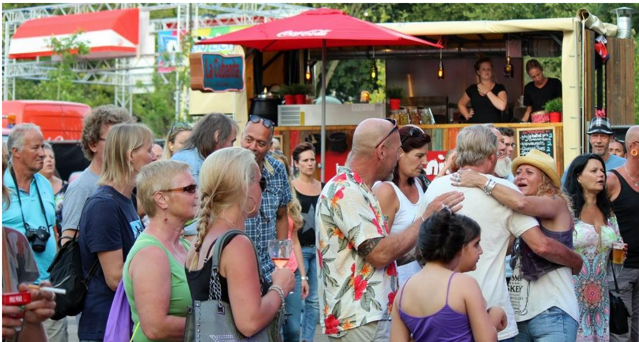
Al vroeg druk vanwege Foodcarts