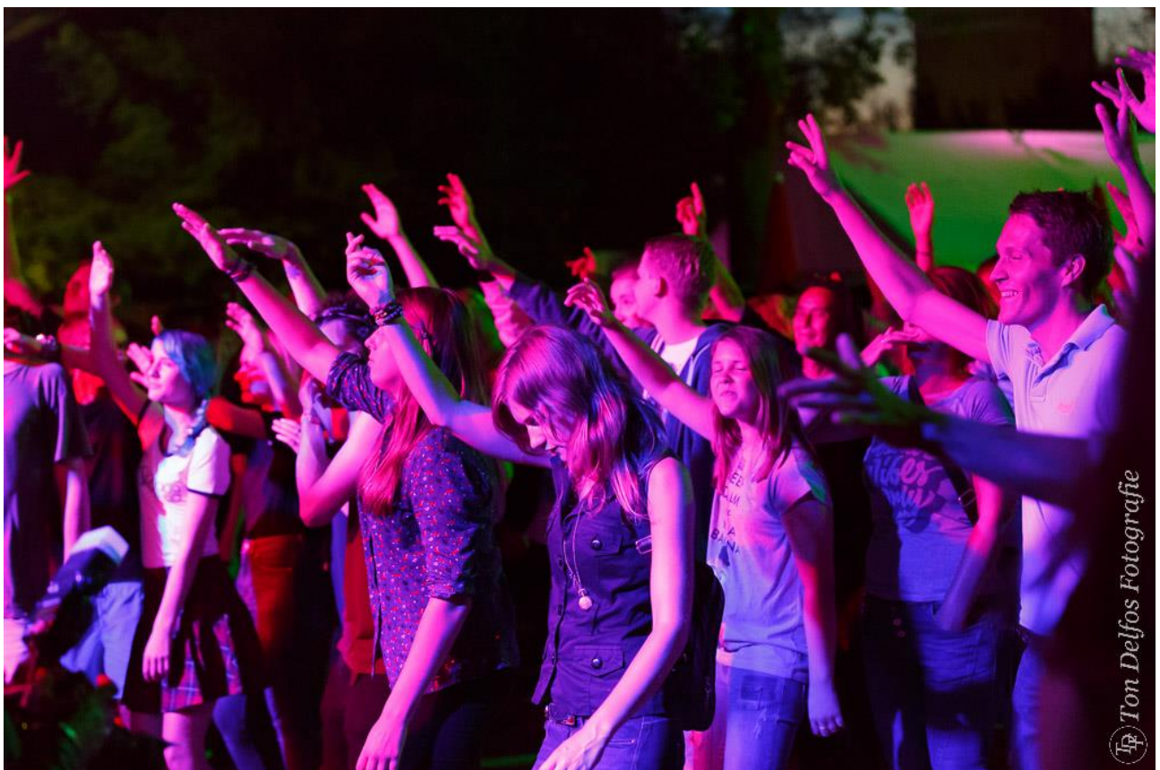
Klassieke wereldmuziek op zondag