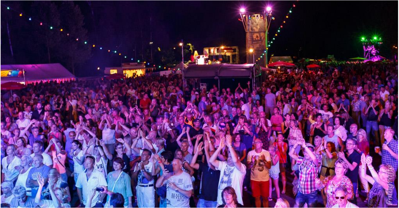
Publiek geniet volop