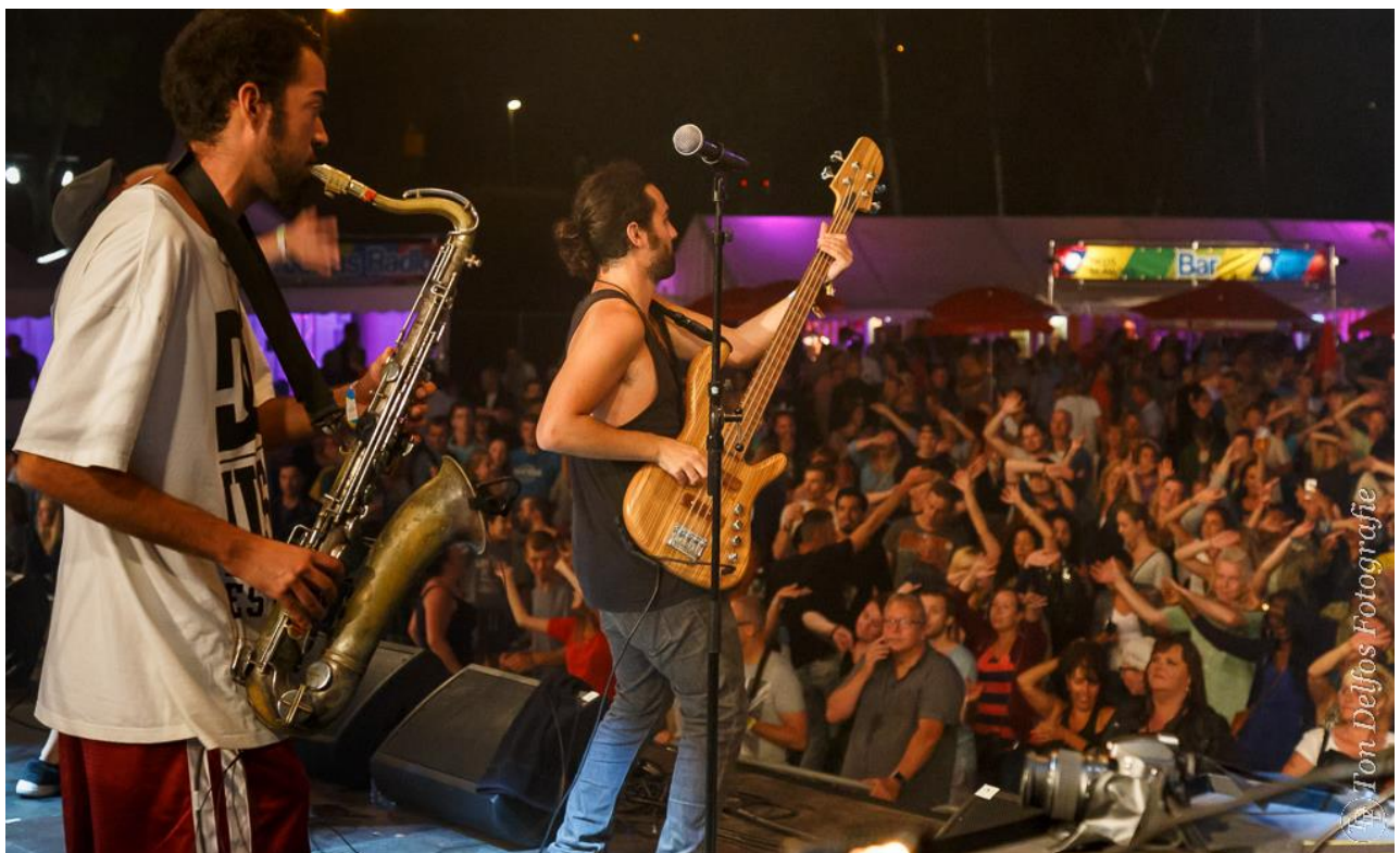
veel enthousiasme voor onbekende Spaanse band