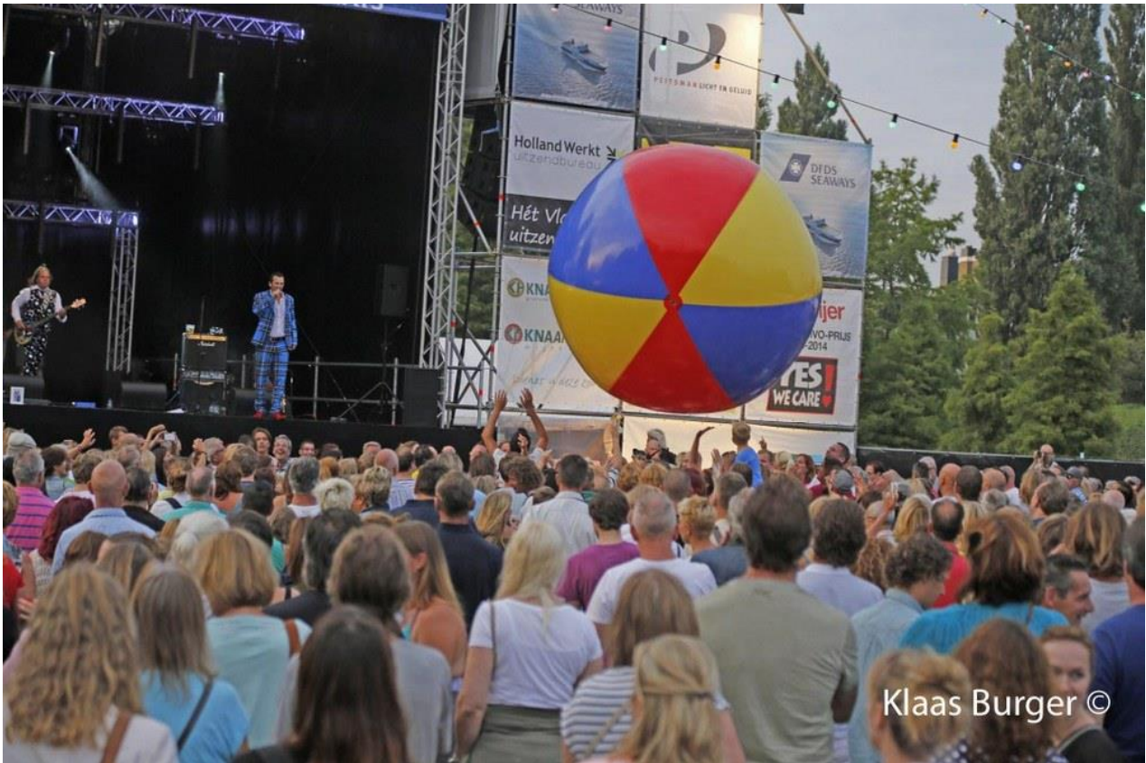
Lokale band "De Vaart" opent het Zomerterras succesvol