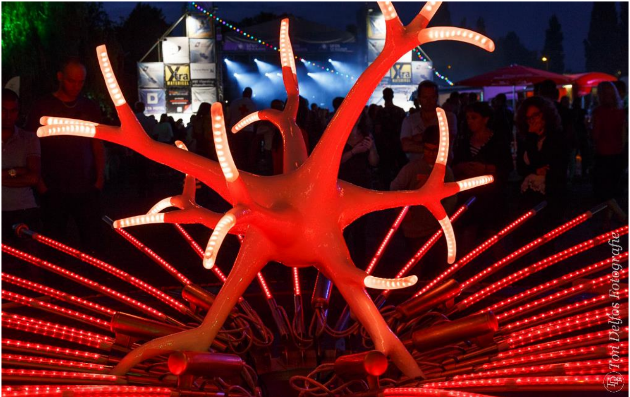
Interactieve beeldende kunst